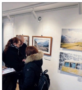
Georgia Ultimi giorni per la mostra fotografica

Tempo fino a domenica per scoprire la Georgia